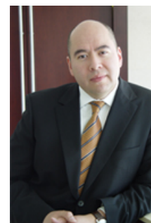
Por: Alejandro Aceves , Socio de la Práctica de Impuestos de KPMG en México